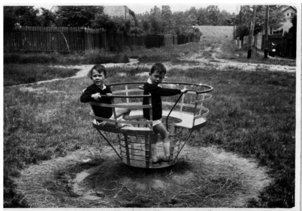
A Szegedi Cipőgyár munkáskollektívája által készített játék a panelosítás előtti Csillag téren, az 1960-as években. 17

évek közepére ez a szám az ötszörösére nőtt. 15 A hatvanas évek játszótereinek nagy része társadalmi munkával épült fel különösebb koncepció nélkül, a szegedi Csillag téren például a Szegedi Cipőgyár munkáskollektívája, a Klapka György téren a Köztisztasági Vállalat dolgozói készítettek társadalmi munkában játszótéri alkalmatosságokat. Ugyanekkor Budapesten mozgalom indult a játszóterek patronálására. „Nagymama: Jé, ennek a hintának már van lánc? Unoka: Igen, apuka rátette” – idéz Fehér Kálmán újságíró egy tipikus játszótéri beszélgetést. 16 Tehát az 1960-as évek a szovjet mintára hegesztett rakétamászókák és láncos hinták időszaka.