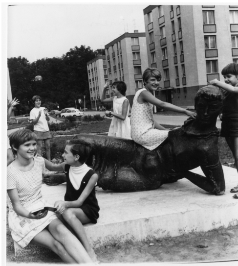
Odesszai gyerekek Madarassy Walter Fekvő nő című szobrával a hetvenes években. 14

ott lakók helyben elérjenek minden szolgáltatást. Óvodák, iskolák, orvosi rendelők kaptak helyet a házak között, alul pedig kisebb üzletek, mosodák. A hatvanas években presztízs volt lakótelepen élni, egyrészt az életminőség, másrészt az elérhető közfunkciók miatt. 11 Az évtized lakótelepei elsősorban az átmeneti zónákban épültek fel, megindult a lakótelepi építkezések kifelé tolódása. A 15 éves lakásépítési program miatt – melyben egymillió lakás építését célozták meg – új technológiákra volt szükség, így az állam a hatvanas évek második felében megvásárolta a házigyárakat: elkezdték a panelelemek tömeges gyártását, emellett pedig típusterveket is alkalmaztak. A lakótelepekkel szembeni megítélés változását a szocialista lakásfilmek is tükrözik: míg a hatvanas évek filmjeiben ( Két emelet boldogság ) a lakástematikát optimista hangon, vigjátékban dolgozzák fel,