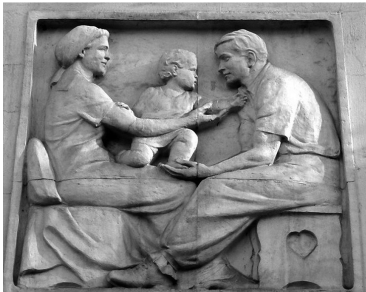
Tápai Antal gyermekével játszó családot ábrázoló domborműve a kapuzat felett Szegeden, a Hajnóczy utcában, 1955. 5

lusú lakóházának terrakotta domborművén Tápai Antal 4 az ötvenes évek tipikus, elvárt, idealizált családmodelljét mutatta be, akiknek a rendszer ezeket a lakásokat megálmodta. Ugyanakkor a gyermek közel sem foglalt el olyan központi helyet a termelésre fókuszáló államberendezkedésben, mint ahogyan azt a sematikus ikonográfiai program mutatja.