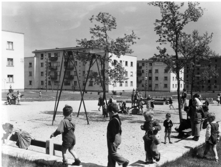
Sztálinvárosban, a Május 1. utcai házak mögötti park a Vasmű (Sztálin) úti házak hátsó frontja felé nézve egy libikókával, hinta nélküli hintaállvánnyal, 1953 körül. 6

A Rákosi-kor játszótereire példa Szegeden az 1953-as, mára már jócskán átalakított Valéria téri (ma Bartók tér) játszótér tervrajza, melynek szimmetrikus szerkezete a szocreál építészet eszméit tükrözi. 7 A centrális, minden pontból belátható tér a felügyelt helyek sajátossága, melyen egy hinta és egy rakétamászóka kapott helyet. A tervrajz szabályos, parkosított környezete helyett a valóságban salakkal felszórt terep és szórványos növényzet, az emeletráépítések miatt bomladozó kullisszák keretozték a teret.