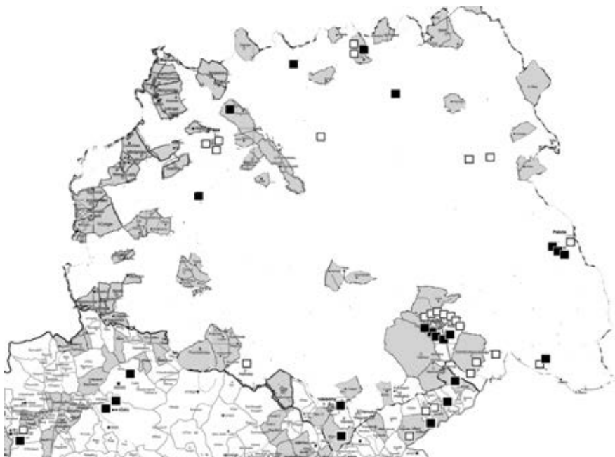
A Veszprém megye területén lévő nyugati és keleti körülhatárolt terület honfoglalás kori temetkezései. Sötét négyzet: lovas-fegyveres, üres négyzet: köznépi

Végezetül a Szőke Béla kisalföldi közlésében található térképet összevetve a fentebbi nagy áttekintő térkép Győr megyei részével, ugyanazt tapasztaljuk, mint az előbbiekben. A Dunától délre, illetve a Csallóközből gyűjtött 16 lelőhelyből 4 a Gyórhoz Csorna felől becsatlakozó, illetve Enese felé kerülő belső gyepűsávokra esik, míg 8 az I. külső gyepűsáv Marcal és Rába menti részén található. Továbbá 3 másik a csallóközi induló szakaszán, 1 pedig a két Duna-ág találkozásánál van. 48