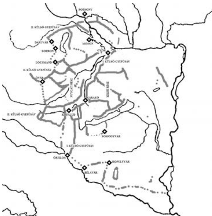
A dunántúli egyházbélyes nemesi településsávok és a várak

pográfiajuk felvázolása. A fejtegetésem tehát egyrésztől nagyon is konkrét topográfiai, régészeti és történeti adatokon alapszik, másrésztől a belőle levont következtetéseknek akkor is többféle értelmezése lehetséges, ha minden egy irányba mutat. Ezután tehát az eddigiek alapján az alapfelvetésem már az lesz, hogy egyértelműen egy gyeplétszám lenyomata rejtezik a településsávok mögött és azt fogom megnézni, hogy a fentebbiek miként értelmezhetők ennek alapján.