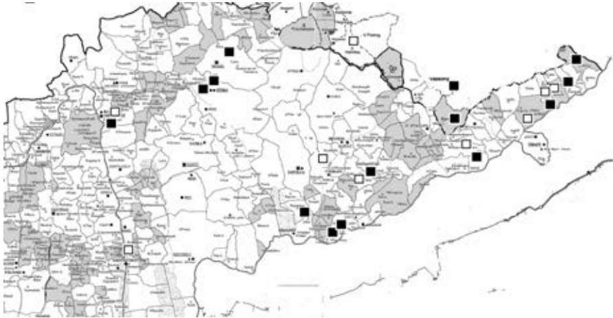
10–11. századi temetkezések és a zalai körülhatárolt terület egyházhelyes nemesi településsávjai. Sötét négyzet: lovas-fegyveres, üres négyzet: köznépi

Mindebből két következtetést rögtön levonhatok, elsőben mind a lovas-fegyveres, mind a köznépi sírok topográfiaja egybeesik a településsávval, másodsorban ennek köszönhetően a 10. század első harmadától egészen a végéig keltezhetjük az I. külső gyeű mögötti zalai településsávokat. Feltűnő még, hogy a két csoport temetkezései nem válnak el területileg, így lényegében vegyesen fekszenek.