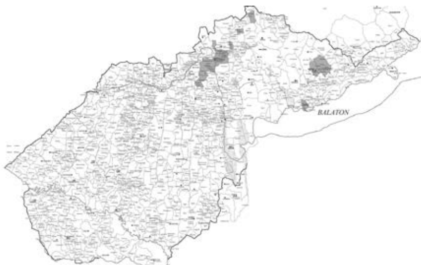
A zalai eredetű nemzetségek birtokai