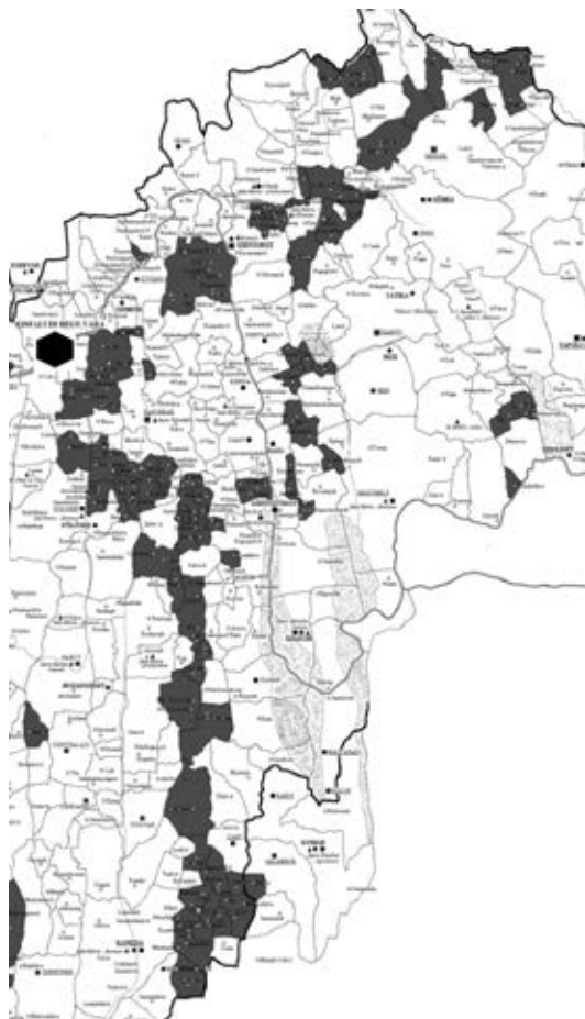
Zalaszentiván, Kisfaludi-hegy vára a II.2.-es sáv kanyarulatában

A II. településsáv több más szempontból is érdekes, mivelhogy a vármegye mindkét királyi alapítású korai bencés apátsága, a zalai (1019 vagy 1024) és a tihanyi (1055) is annak hátában található. 18 Ugyanez elmondható a Marcal mentén a Dunáig érő északi szakaszon is, amitől nyugatra már egyetlen királyi alapítású apátság sem található, míg attól keletre Pannonhalma, Bakonybél és Somlóvásárhely. Ugyancsak a II.2-es településsáv közvetlen hátában található a veszprémi püspökségnek 1009-ben adományozott Marcalfő birtoka, amely a későbbi Sümeg környéki püspöki tartománnyal azonosítható. 19 Az egyházi birtokterületek mellett legalább ilyen árulkodók a nemesi kézben lévők, így a II. településsáv időrendjéhez köthető a Tonuzoba besenyő fejedelemtől eredő Tomaj nemzetség Balatonfelvidéki birtokterülete Lesencetomaj környékén, valamint a Vérbulcsú nembeli Lád nem-