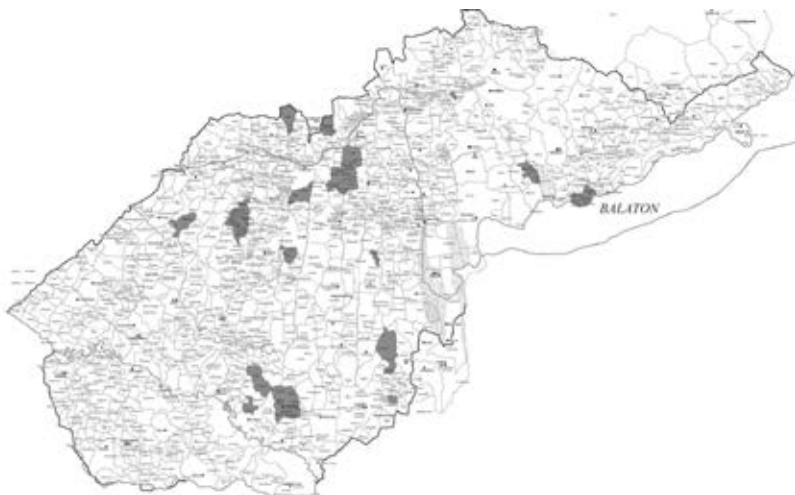
Besenyőekkel összefüggésbe hozható birtokok Zala megyében