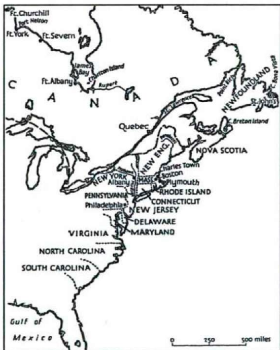
3. térkép: Észak-amerikai gyarmatok.