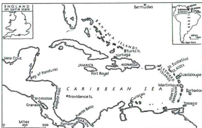
4. térkép: A karibi térség.