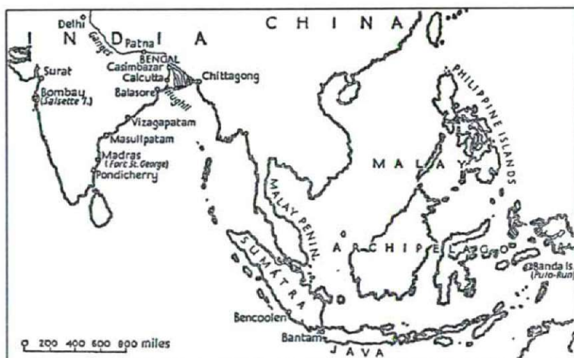
5. térkép: Kelet-India.