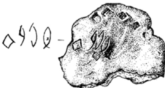
2. ábra: Az Alsóbüi Felirat (MAGYAR 2000)

törtött perem mellett van, távolabb az előző három betű csoportjától, így valószínű, hogy a letört részen további jelek voltak. 60